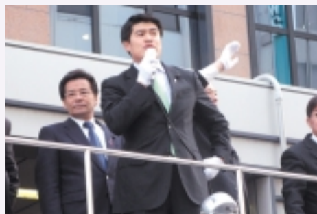
定期的な街頭演説で県政についてご報告