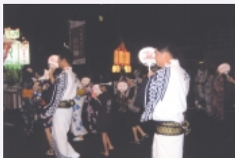
新潟まつり大民謡流し(8/7)・新津松坂流し(8/17)に参加