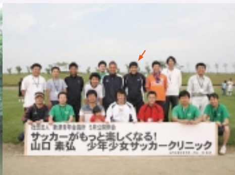
新津青年会議所での活動(里山イベント・サッカー教室など)