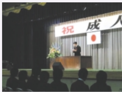
秋葉区成人式に出席、祝辞