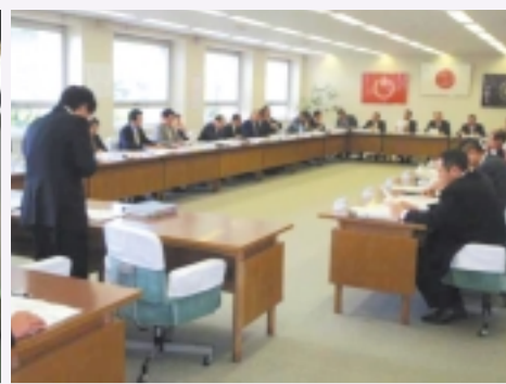
自民党・党議にて様々な議論を