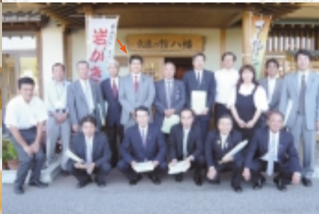
総務文教委員会県内視察(県政記念館・ほんぼーとなど)