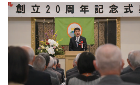
秋葉区金津コミ協 創立20周年式典