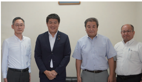
下越南地区郵便局長会様 要望活動 (新潟事務所にて対応)