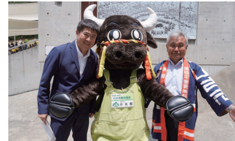
全国闘牛サミット 山古志