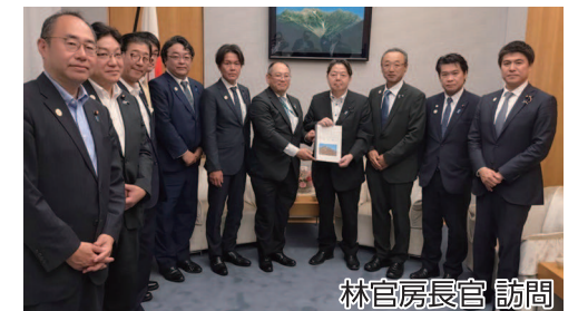
「佐渡島の金山」の世界遺産登録の実現に関する政府に対する要望活動