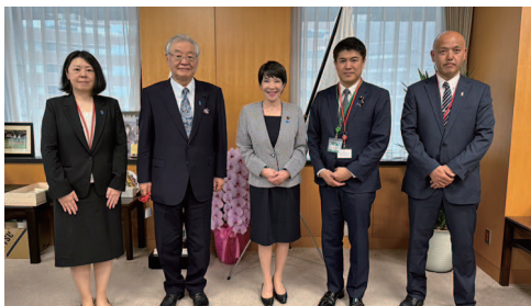
高市経済安全保障担当大臣訪問 要望活動

※紙面の関係で、すべての皆様の掲載することができず、一部のみのご紹介となります。