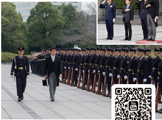
防衛省・儀仗広場にて 栄誉礼

安全と平和を守るため最前線で活動する自衛隊員の皆様のご貢献に心からの敬意と感謝の念を捧げて参りました。