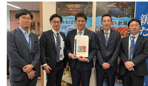
新潟県上越市様 令和7年度国の制度・予算に対する要望活動