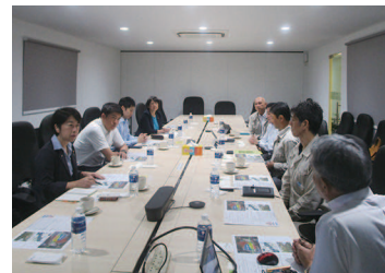
RTSの工事現場等を視察