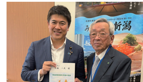
新潟県土地改良事業団体連合会様 令和7年度予算要望活動