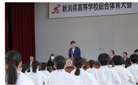
新潟県高校総体 少林寺拳法大会

週末などは地域の会合やイベント等にできる限り参加させて頂いております。地域の皆様の活動を本年もしっかり応援させて頂きます。