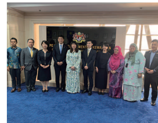
マレーシア財務副大臣訪問