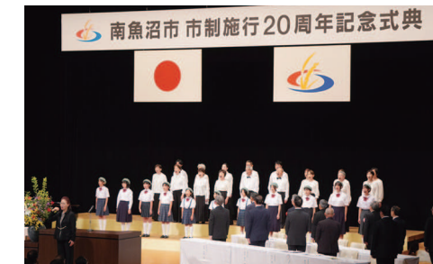
南魚沼市 市政施行20周年記念式典