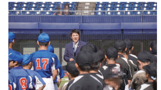
阿賀野市チャレンジジュニアベースボール大会