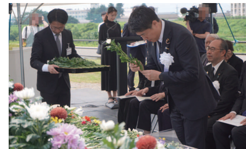
三条五十嵐川 水害黙祷献花式