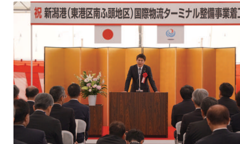
新潟港国際物流ターミナル整備事業着工式典