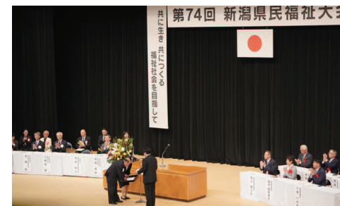
新潟県民福祉大会