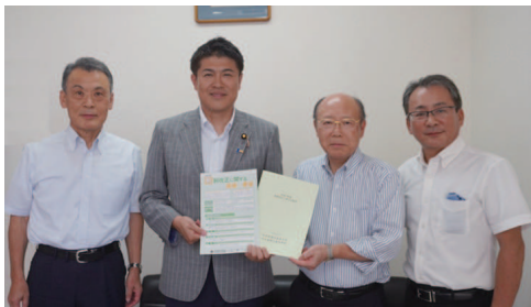
新潟県税理士政治連名様 要望活動 (新潟事務所にて対応)