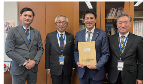
新潟県私立中高協会様 要望活動