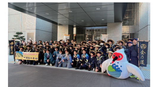
佐渡市「御金荷の道」ウォークイベント