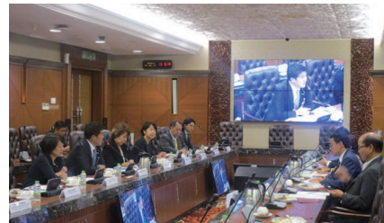
マレーシア下院議員との懇談