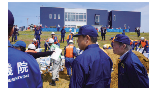
信濃川下流総合防水演習