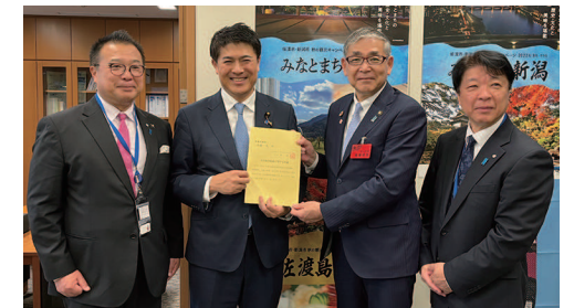
新潟県災害普及促進に関する要望活動