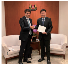
シンガポール運輸大臣

両国で日本人墓地に訪問。献花とともにご苦労頂いた先人の皆様に手をあわせて頂きました。